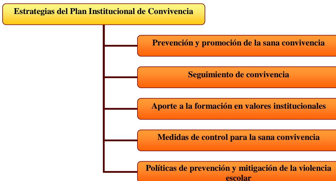
Figura C. Estrategias del plan institucional de convivencia. Tomado de Plan institucional de convivencia Gimnasio San Angelo

de antecedentes; justificación; planteamiento de objetivos; factibilidad (recursos y apoyos, humano, tecnológico, pedagógico, didáctico); marco de referencia; y cronograma.