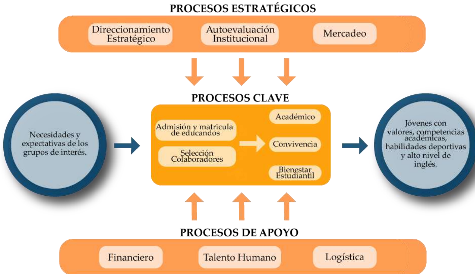
Mapa general de procesos del Gimnasio San Angelo