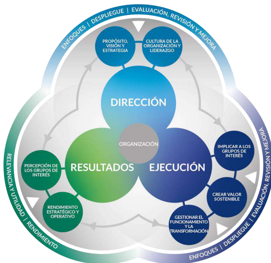
Figura C. Modelo EFQM tomado de club excelencia en gestión (2019).

transformación; percepción de los grupos de interés; y rendimiento estratégico y operativo (ver figura C).